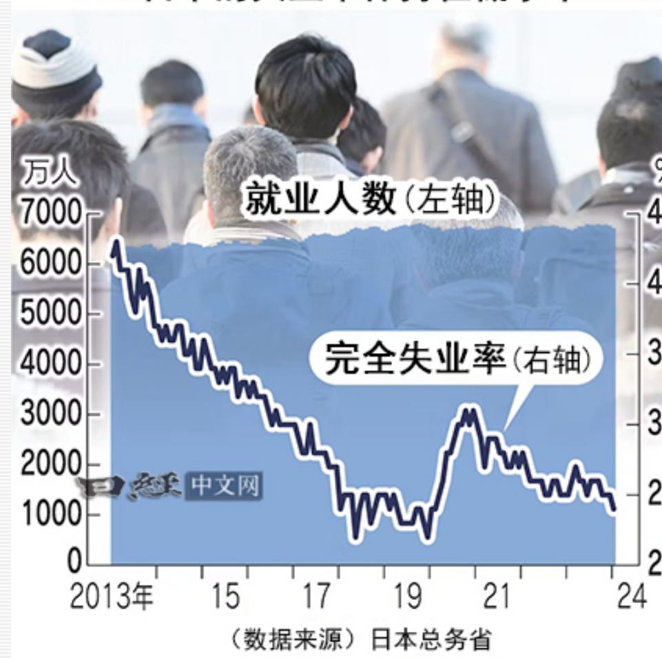
日本的失业率保持在低水平